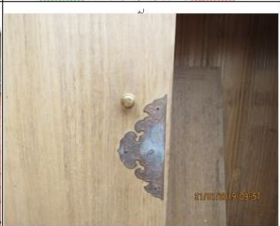
銅片鏽蝕，木板門脫落