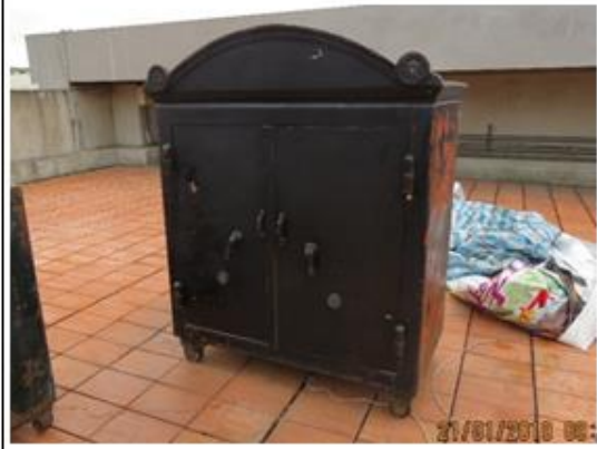
左側 45 度照