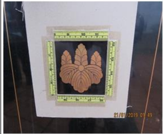
第一層門內側有五七桐紋