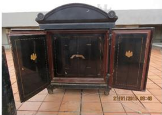
奉安櫃內第一層門開啟整體照