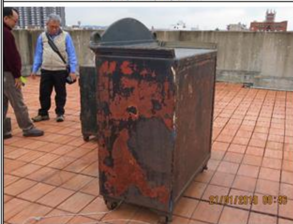
左、右、背立面外表脫漆