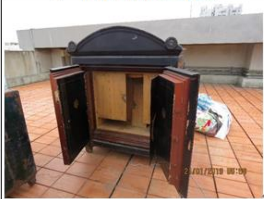
奉安櫃第二層鋼板開啟可見第三層木門