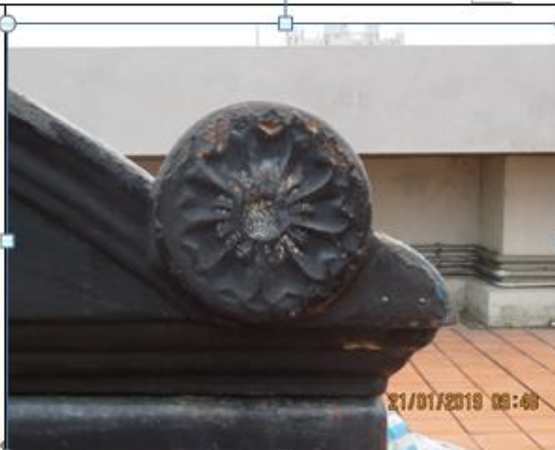
正立面上方山牆兩側 16 瓣菊花紋