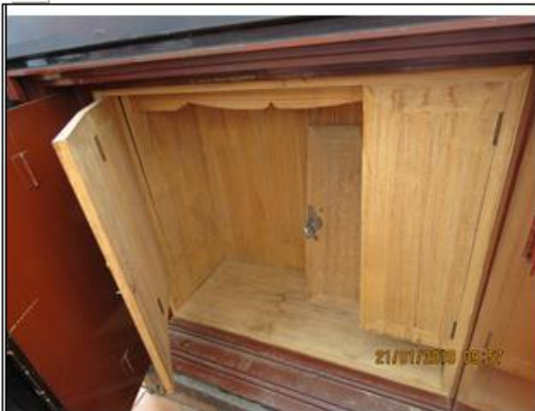
第三層木門開啟內部空間